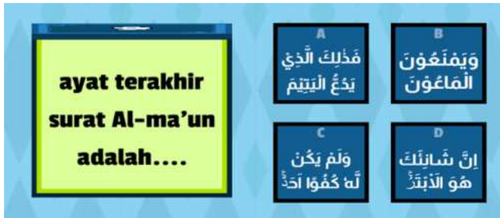
Gambar 3. Tampilan Soal PAI yang dibuat oleh guru