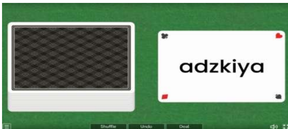
Gambar 1. Fitur Random Cards

Fitur wordwall yang digunakan oleh guru PAI yaitu fitur open the box dan random cards , karena sesuai dengan kebutuhan pembelajaran dan siswa juga suka. Berikut adalah fitur yang digunakan oleh guru PAI di SD Tahfizh Qur'an Mardhatillah: