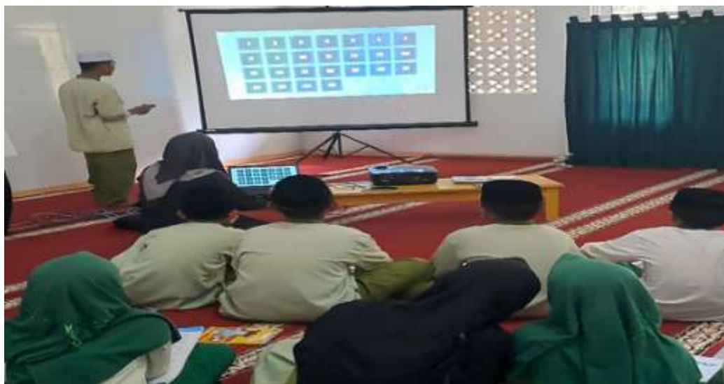
Gambar 4. Pembelajaran PAI menggunakan media wordwall

Berdasarkan wawancara dengan guru PAI, mengenai langkah-langkah pembuatannya adalah sebagai berikut: