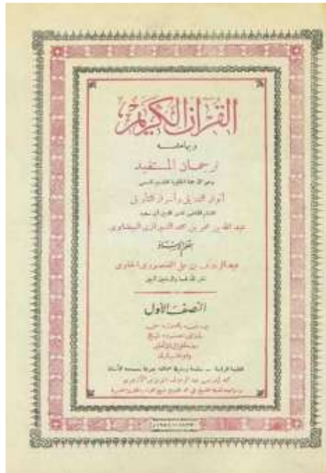
Gambar 1. Sampul Kitab Tafsir Tarjuman al-Mustafid